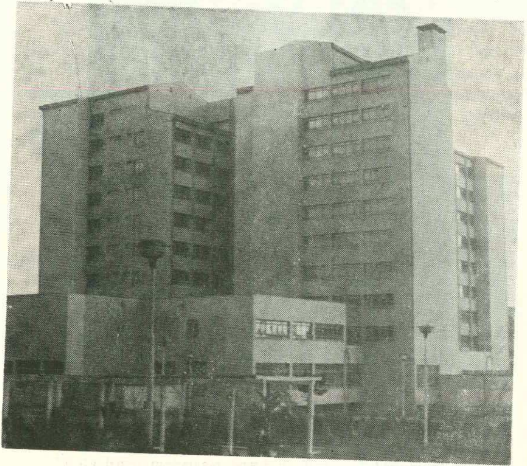
Sağlık ve Sosyal Yardım Bakanlığının Cumhuriyet Üniversitesi Tıp Fakültesine tahsis ettiği, Sivas'ta yeni inşa edilmiş olan 400 yataklı hastahane.

15.000 dönüm büyüklüğündeki üniversite arazisindeki binaların inşaatı, 273 milyon liraya Dilek İnşaat Şirketine ihale edilmiş olup, projeleri Sisag şirketi tarafından hazırlanan binaların 1978 yılında tamamlanması gerekmektedir. Ayrıca, İş Bankası Genel Müdürlüğünün Üniversiteye ve dolayısıyla Sivas Yüksek Öğrenim gençliğine hediye ettiği 800 öğrencilik yurt ta 17 milyon liraya ihale edilmiş olup, aynı kampusta İş Bankası tarafından inşa ettirilmektedir. Sağlık ve Sosyal Yardım Bakanlığı, yeni inşa et-